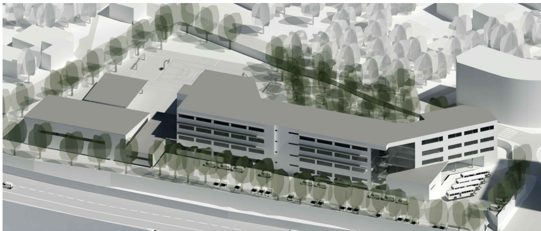
VISTA FRONTAL INFOGRÁFICA