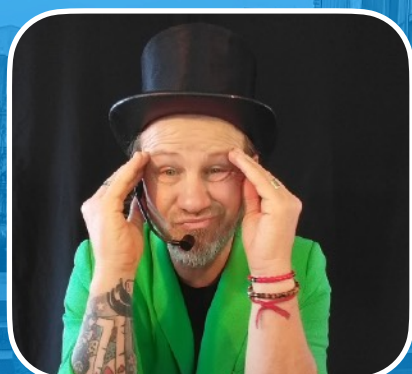
REY MIDAS (Argentina)