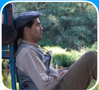
MAGO TETO (GALICIA)

I FESTIVAL DE MAXIA DE RÚA DE VIGO DO 6 AO 9 DE ABRIL DE 2023